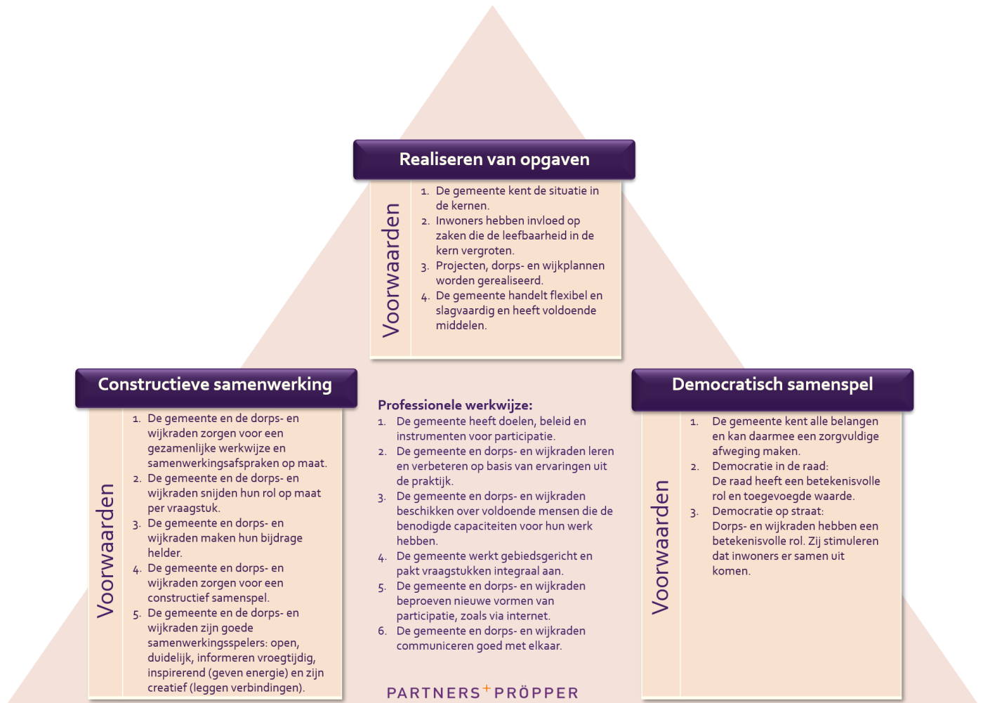
Figuur 2.1: Verdiepend evaluatiemodel met subnormen voor het opsporen van oorzaken voor een achtergesteld gevoel van inwoners van de kern Moergestel binnen de gemeente Oisterwijk.